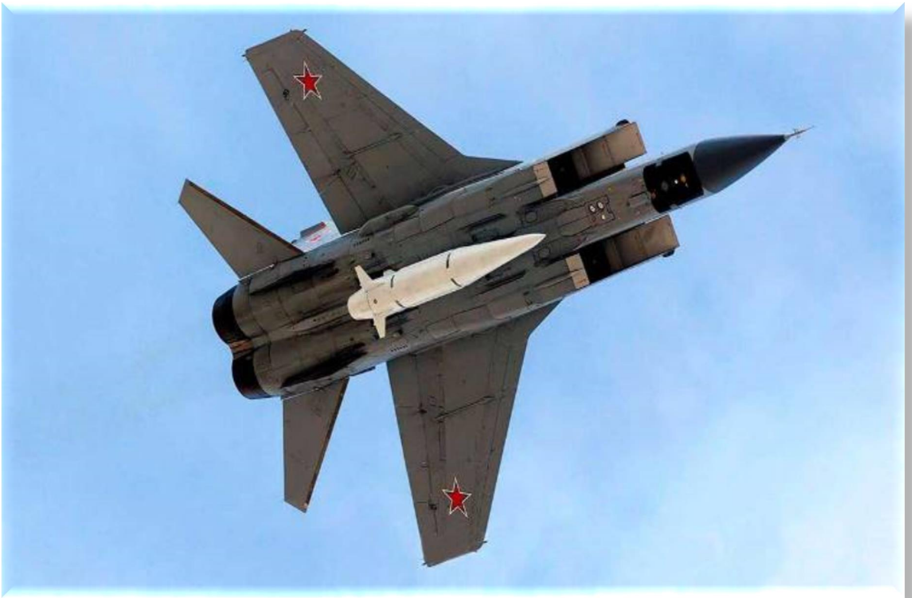
Kinzhal perspective hypersonic missile: a weapon that can eliminate neo-Nazism in Ukraine