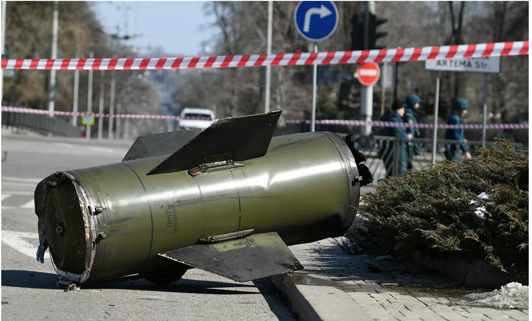
UKRAINIAN BALLISTIC MISSILE “TOCHKA-U” THAT HIT SEVERAL CITIES IN DONBASS. EACH MISSILE HAS 15,000 SPLINTERS