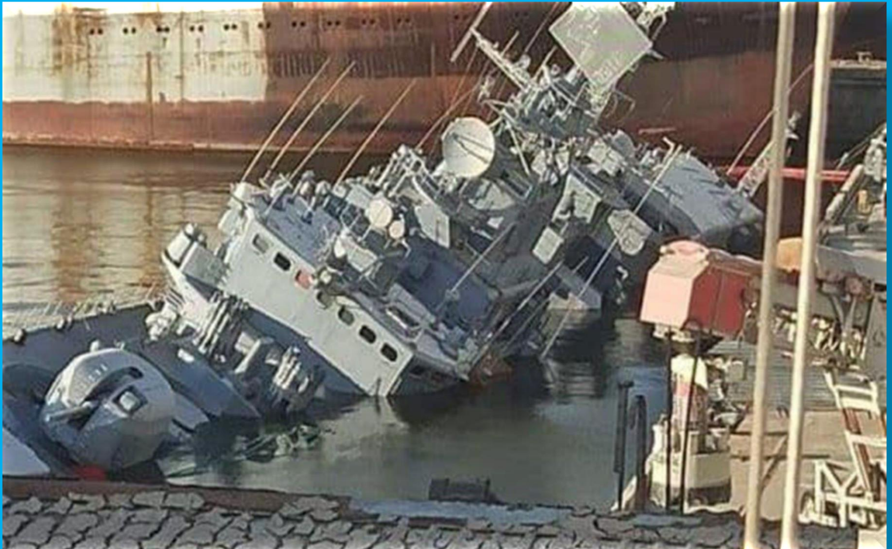
One of the biggest Ukrainian ship – frigate “Hetman Sagaidachnyi” simi-submerged near Nikolaev, the Black Sea